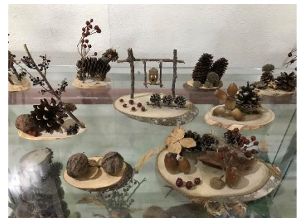
自然の家の作品例