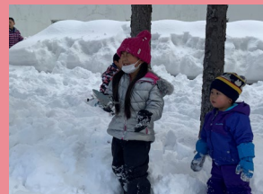
英語で宝探しゲーム