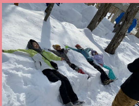
大人も子供も楽しい♪