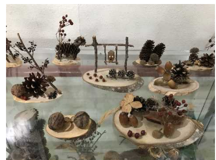
自然の家の作品例