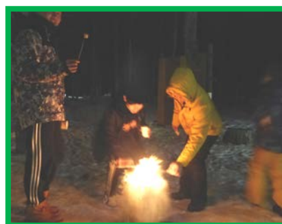
ナイトプログラム