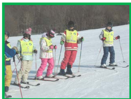
緩斜面でのレッスン