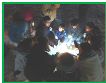
火でマシュマロをあぶる