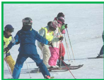
スキー初心者クラス