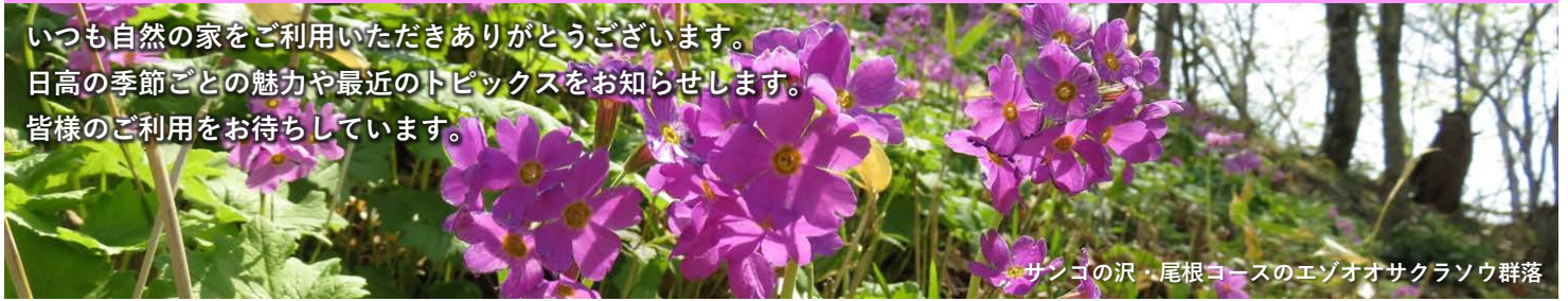
サンゴの沢・尾根コースのエゾオオサクラソウ群落

いつも自然の家をご利用いただきありがとうございます。 日高の季節ごとの魅力や最新のトピックスをお知らせします。 皆様のご利用をお待ちしています。