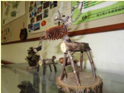
ネイチャークラフト