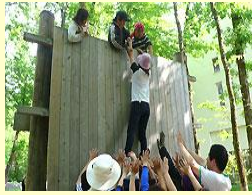
日高アドベンチャー