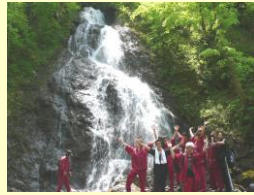
サンゴの滝ハイキング