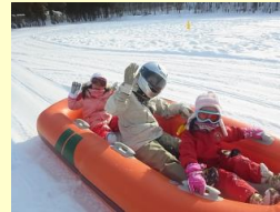
スノーラフティング