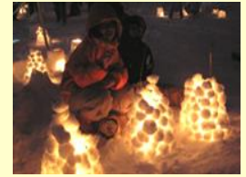
スノーキャンドル